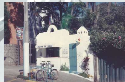
Primeira unidade Néctar, no bairro Serra, em 1993.

Numa pequena loja da avenida Bandeirantes nasceu uma grande ideia: Produzir alimentos leves, naturais e saudáveis.